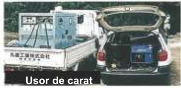
Usor de carat